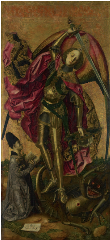
Adquirida en una compra privada realizada gracias a la aportación económica de los American Friends of the National Gallery, por mediación del Mr. J. Paul Getty Jr's Endowment Fund, 1995

Empezaremos nuestro recorrido por una de las pinturas españolas más antiguas de la colección que se encuentra en la sala 63.